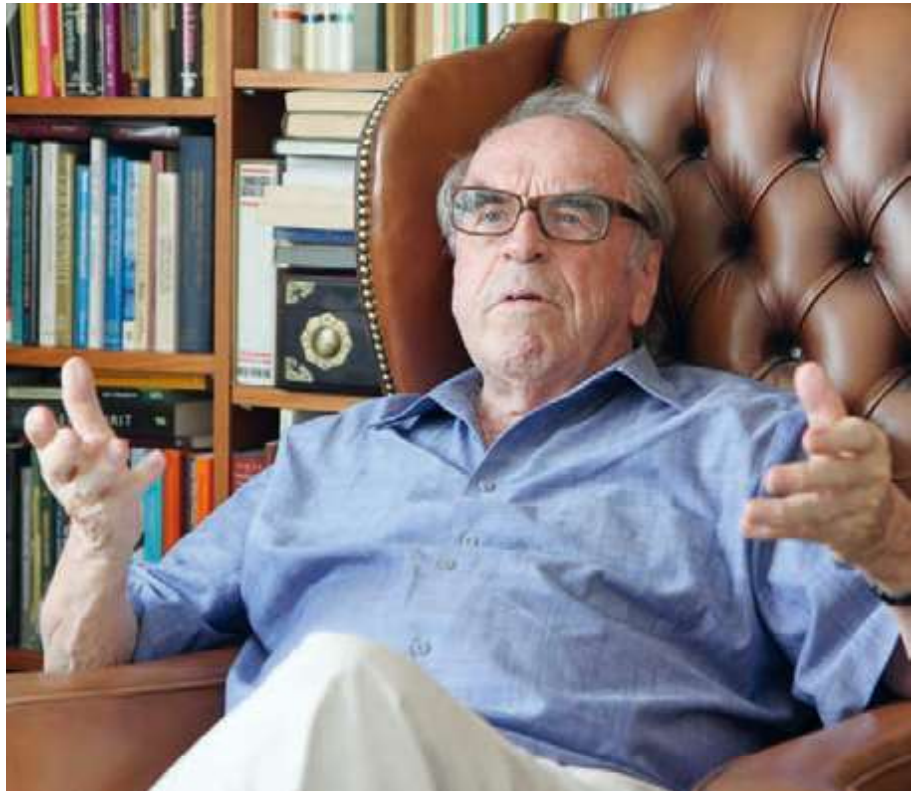
Im Studierzimmer von Prof. Dr. Jürgen Moltmann

Professor Dr. Jürgen Moltmann (Jahrgang 1926) lehrte zunächst an der Kirchlichen Hochschule Wuppertal und an der Universität Bonn. Von 1967 bis 1994 war er Professor für Systematische Theologie an der Eberhard-Karls-Universität Tübingen. Seine 1964 erschienene „Theologie der Hoffnung“ begründete seinen internationalen Ruf und wurde in viele Sprachen übersetzt. Das Werk gilt als eines der meistgelesenen und einflussreichsten Bücher der jüngeren Theologieschichte.